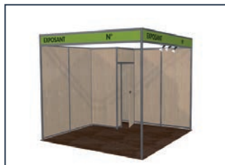
Visuel non contractuel