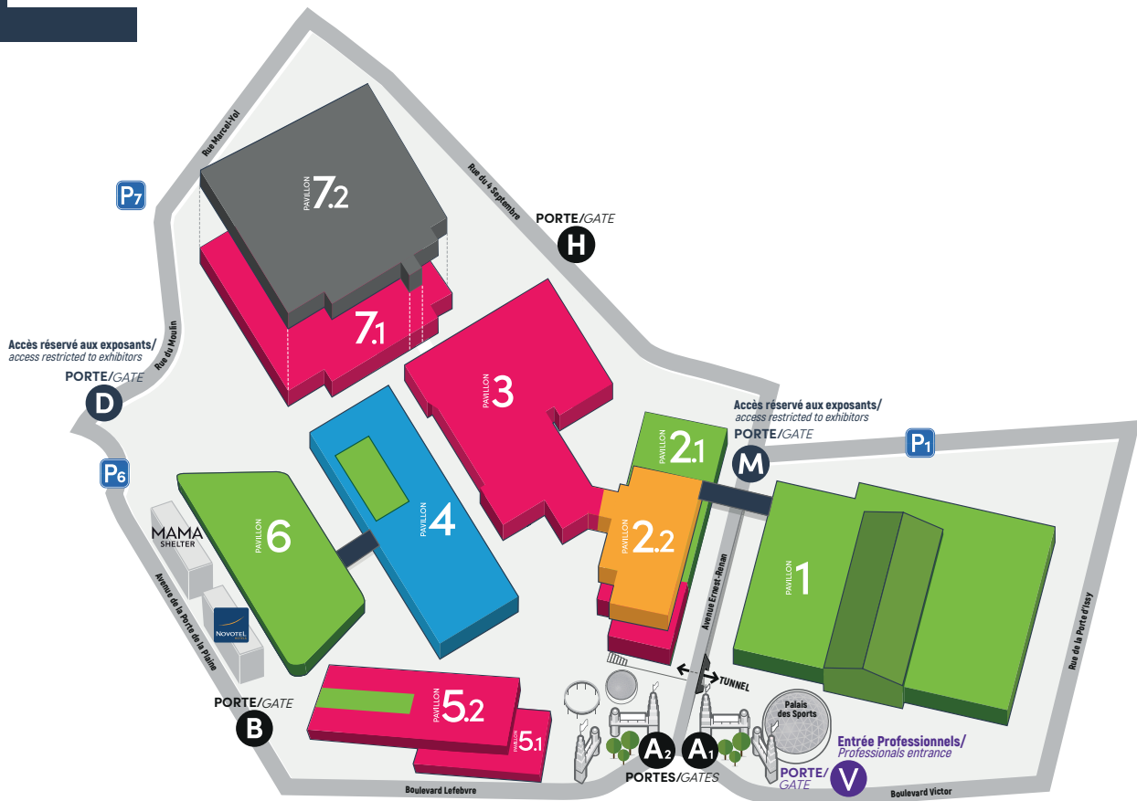
Plan arrêté au 23/05/2024, susceptible de modifications